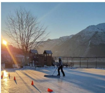
Det var vinteridyll på Sekse i desember. Snøen vart skufila bort med handmoker av dei som brukte isbanen.

Føyk idrettslag fekk hjelp av gode dugnadskrefter som både organiserte og tok det fysiske arbeidet med isen som er sprøyta på fotballbanen ved barnehagen.